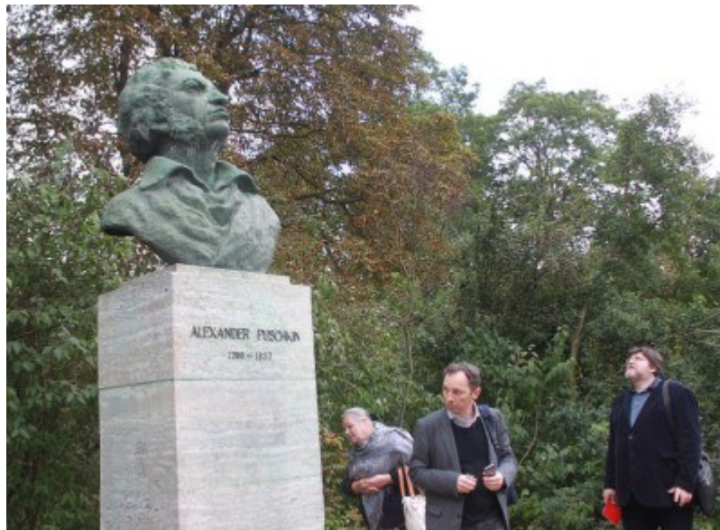
У памятника Пушкину в Веймаре

Пушкинское общество определяет новое место выездной встречи по принципу чередования Западных и Восточных земель Германии.