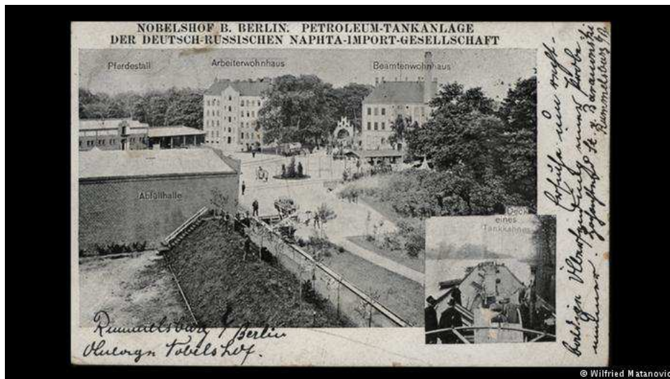
Открытка Немецко-русского общества импорта нефти

Пять лет назад у меня вышла книга, посвященная истории Берлина 1900-1945 годов в открытках. Небольшая глава в ней была про русских, но материал, который мне удалось найти, оказался огромен. И это стало началом пятилетней работы над тематической выставкой.